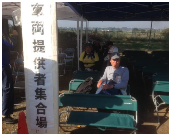
「車両提供者集合場」