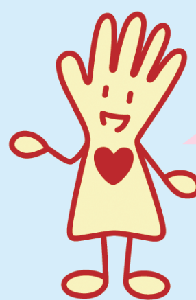
茨城県社会福祉協議会 キャラクターマーク 「はんどちゃん」

こんなときご相談 ください。 ご本人はもちろん、 ご家族の方々の不安や ご相談にお応えします。