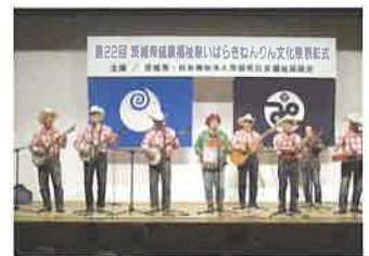
茨城シニアマスターによるブルーグラス演奏の様子