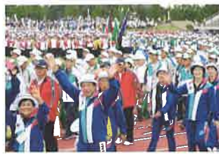
ねんりんピック秋田大会茨城県選手団入場の様子

60歳以上の方々を中心として、あらゆる世代の人たちが楽しみ、交流を深める健康と福祉の総合的な祭典である「第31回全国健康福祉祭とやま大会(ねんりんピック富山2018)」に本県の代表を派遣するとともに、美術作品を出展します。