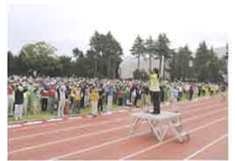
ねんりんスポーツ大会開会式準備体操の様子