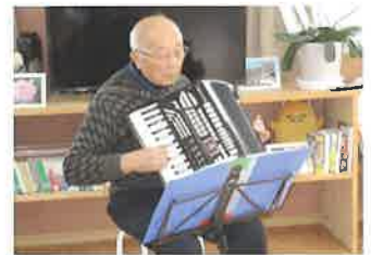
茨城シニアマスターによるアコーディオン演奏