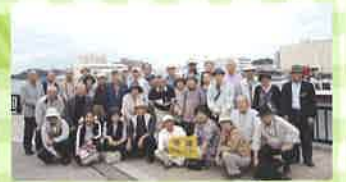
ヨコスカ軍港めぐりクルーズの旅

サラリーマンOB等の生きがいづくりを応援するため、わくわく推進サポーター会員を対象として、年に8回程度、県内外の名所旧跡見学や自然探訪、美術展覧会の鑑賞などを行います。