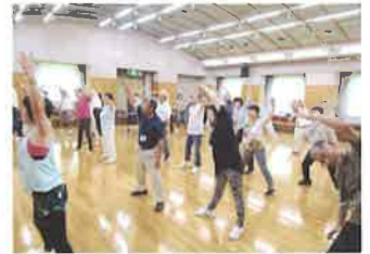
シニア向けヨガストレッチの様子