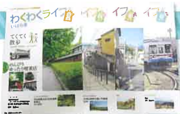
「わくわくライフいばらき」

高齢者の生きがいや健康づくりに関する各種情報を提供するため、総合情報誌を年4回発行し、わくわくサポーターをはじめ市町村等関係機関・団体、理・美容店、病院、公民館等へ配布します。