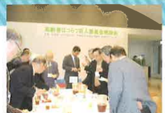
知事との懇談会の様子

委員会は県内を5つの地域に分け設置されており、委員は県内在住の概ね60歳以上の方を対象に、公募により募集を行い、各地域概ね100名の委員が地域ごとの特性に応じて事業を展開しています。委員の任期は2年で、毎年、半数程度の改選で行っています。