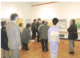
わくわく美術展の様子