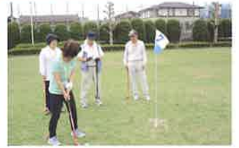
ニュースポーツ推進員養成講習会の様子