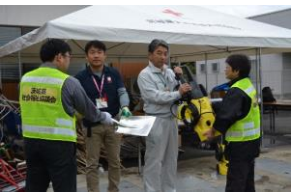
資機材を提供する様子 (常陸太田市)