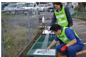
ボランティア活動終了後の洗浄のための消毒液を作る様子 (常陸大宮市)