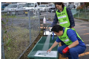
ボランティア活動終了後の洗浄のための消毒液を作る様子 (常陸大宮市)