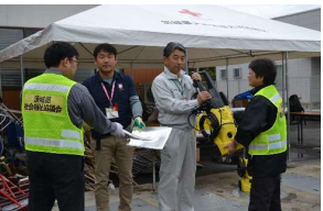
資機材を提供する様子 (常陸太田市)