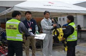
資機材を提供する様子 (常陸太田市)