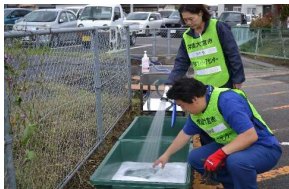
ボランティア活動終了後の洗浄のための消毒液を作る様子 (常陸大宮市)