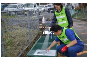
ボランティア活動終了後の洗浄のための消毒液を作る様子(常陸大宮市)