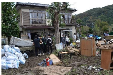
<ボランティアセンターの様子>