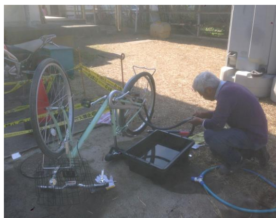
「自転車修理を行うセンタースタッフ」

※ 茨城県内の市町村災害ボランティアセンターに関する情報は、本会ホームページまたはフェイスブックページをご覧ください。