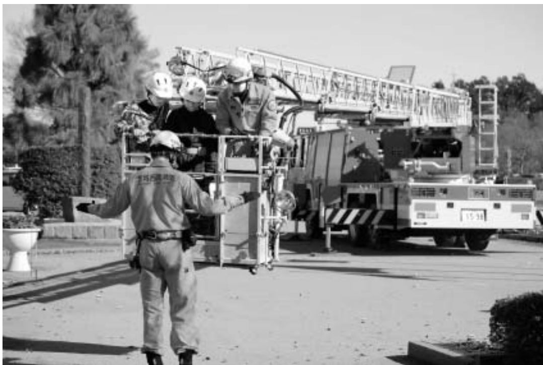
七重地区防災訓練