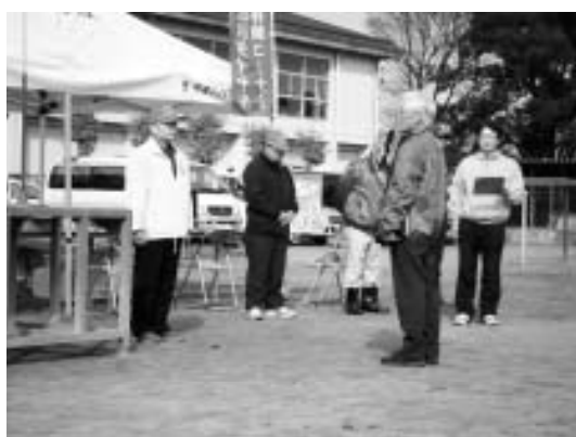
▲被害状況、安否確認の結果報告