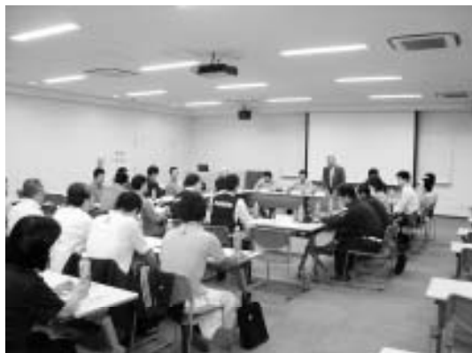
▲打合せ会議の様子

地域の防災対策の充実強化を図るため、「七重地区防災訓練」を実施。（2 回開催、延べ 1,100 人参加）関係者の協力のもとに、消火器やスモークマシンの体験、独居高齢者の安否確認など、災害時を想定した各種訓練を行った。安心・安全なまちづくりの実現に向けて有意義な訓練となった。