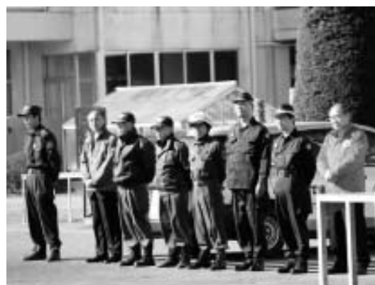
▲関係機関と協働で実施