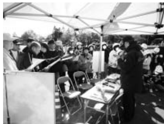
▲N T T災害用伝言ダイヤルの操作説明