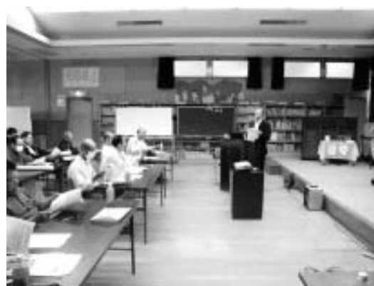
▲講義「災害ボランティアの実際」