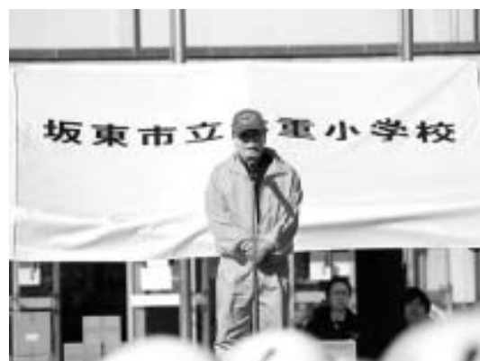
▲訓練当日（七重支部長より開始前の挨拶）