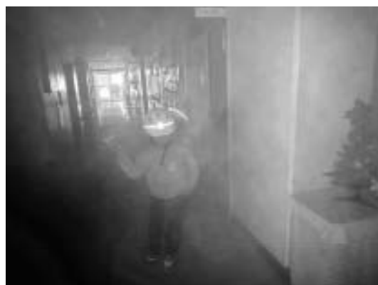
▲スモークマシンの体験