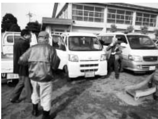
▲独居高齢者宅へ出発(民生委員・青パト隊・防犯団体)