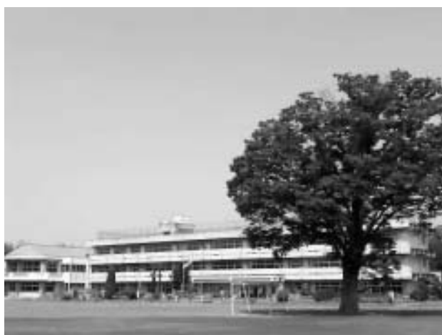
坂東市立七重小学校