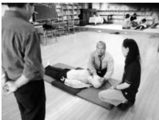
▲普通救命講習（心肺蘇生法）

いつ起こるか分からない災害に備え、迅速、かつ的確な対応や支援活動ができる体制を整えておくことも重要であり、それに協力していただけるボランティアの方々が必要である。そのため、災害発生時に各種支援活動に参加・協力していただける、防災ボランティアの養成を目的として開催した。