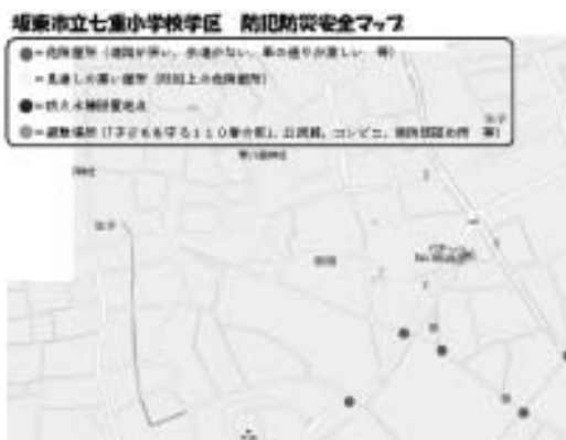
▲地図に危険箇所をシールで貼り付け

七重小学校の全児童（216人）を対象に、学校関係者・保護者・福祉教育推進協議会（40人）が連携して一斉下校時に実施。通学路を歩きながら、自分達が住む地域の危険箇所や防災・防犯施設などの設置箇所を見つけ、安全マップを作成した。