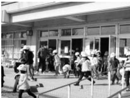
▲地震発生、避難開始