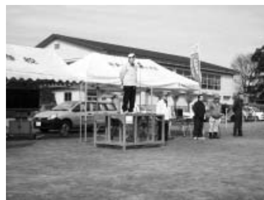
▲訓練終了後の講評(校長先生)