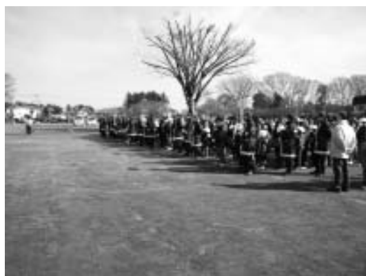
▲行政区ごとに児童を受入れ