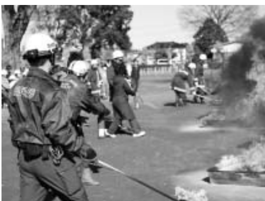
▲消火器の使用訓練