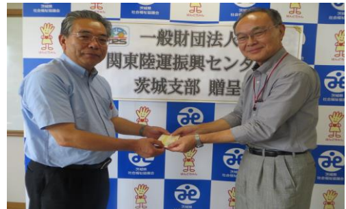
一般財団法人関東陸運振興センター茨城支部 様