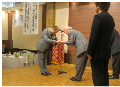
茨城県遊技業防犯協会 様