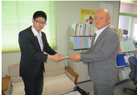
株式会社業電社 様