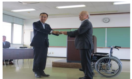
日産プリンス茨城販売株式会社