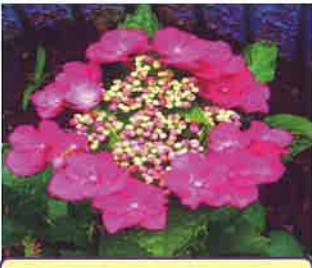
赤い山紫陽花の花