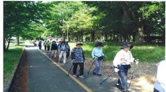
“ポールをしっかりと握って出発”