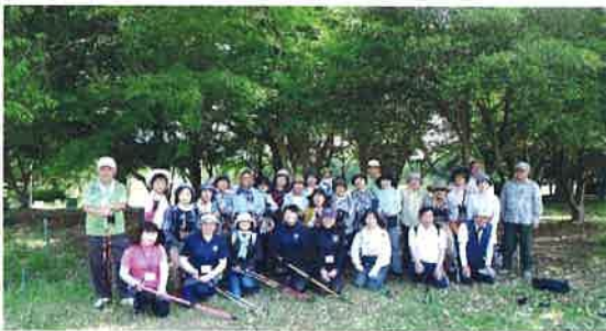
“皆さんの完走した満足顔”