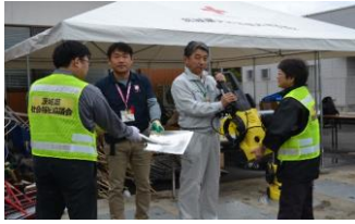
資機材を提供する様子 (常陸太田市)