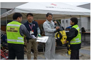
資機材を提供する様子 (常陸太田市)