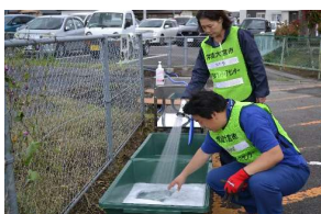
ボランティア活動終了後の洗浄のための消毒液を作る様子(常陸大宮市)