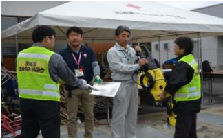
資機材を提供する様子 (常陸太田市)