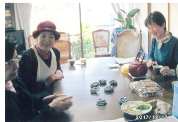
自宅サロンにて 新聞紙を利用したブローチ作り