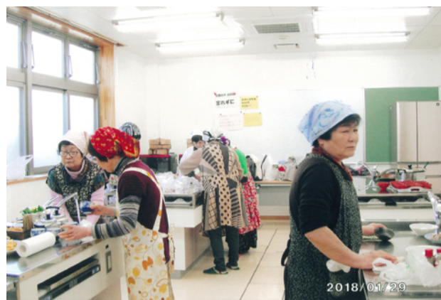
市民センターにて 料理教室