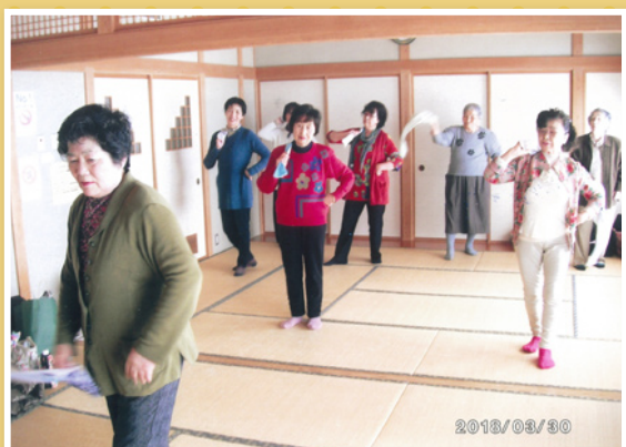
舞踊の先生に依頼して タオルを使って軽体操 (CDに合わせて)