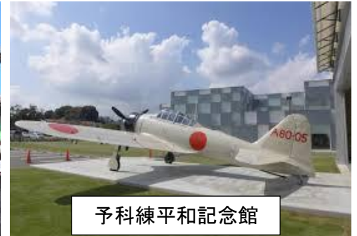
予科練平和記念館

国立歴史民俗博物館（歴博）は、日本の歴史と文化について総合的に研究・展示する我が国で唯一の国立の歴史博物館です。日本文化のあけぼのや江戸時代の復元模型等をご覧いただけます。