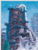
「セメント工場」 國嶋政司 日立市