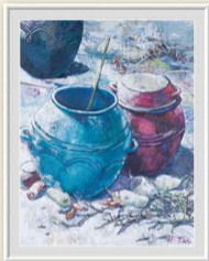
「雪の朝」 郷 春子 水戸市