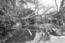
知る人ぞ知る/VFースポットの池と神社