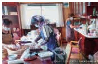
つくばみらい市社協