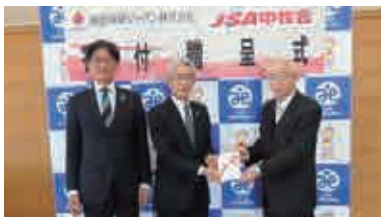
JSA 中核会 茨城支部