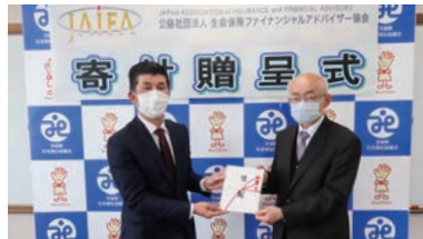
(公財) 生命保険ファイナンシャルアドバイザー協会