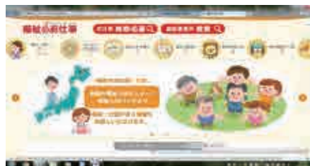
福祉のお仕事ホームページ