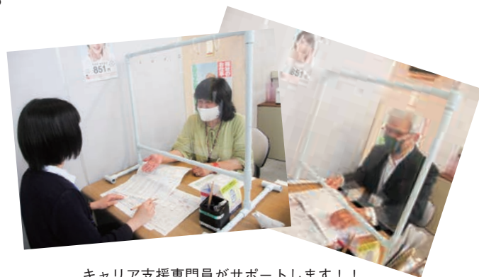
キャリア支援専門員がサポートします！！