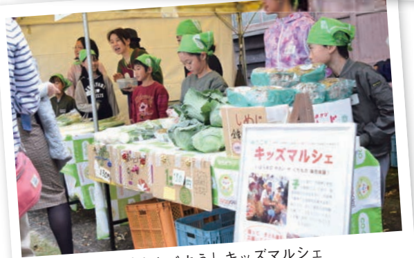
「茨城をたべよう」キッズマルシェ

は協力しています。店舗前のテントでの販売や、毎月1回本部で商品の販売を依頼し、水戸市・日立市・石岡市に所在する福祉施設*で製造しているパンは、ミーティングで訪れる組合員や従業員に大人気です。その福祉施設の皆さんがコロナ禍でレクリエーションに困っていると聞き、2012年からスポンサーになっているサッカーJ2水戸ホーリーホックの「いばらきコープサクスマッチ」に計50名を招待しました。