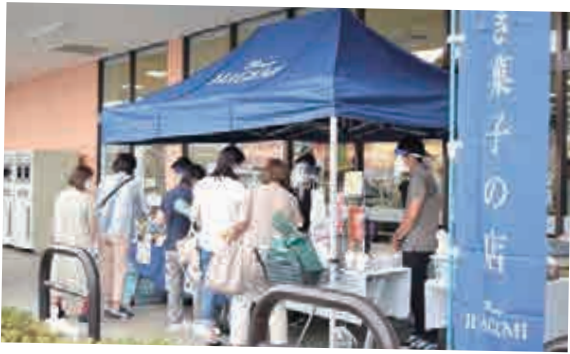
店舗での福祉販売の様子