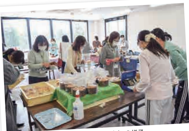
福祉販売（小美玉本部）の様子

このほかにも、NPO法人フードバンク茨城に協力し、食品を寄付できる「きずなBOX」を全店舗に設置したり、水戸市の乳児院に子ども用紙おむつを寄贈するほか、JAとともに県内各所の直売所で小学生たちが野菜の販売体験を行う「いばらきを食べよう! キッズマルシェ」の開催などを行っ