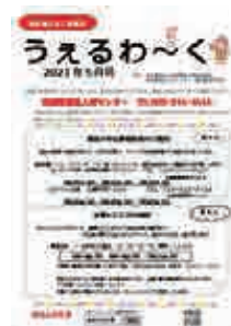
県内福祉職情報がたくさん。