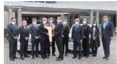
(一社) 生命保険協会 茨城県協会