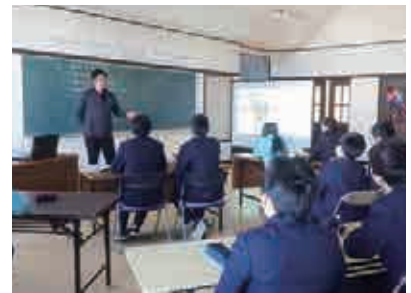
学生の皆様に福祉の魅力を伝えます！ ※画像は2020年1月のもの

福祉・介護の仕事への理解促進・イメージアップを目的に、県内中学校及び高等学校を対象に、「福祉キャラバン隊」を派遣しています。「ふくし“きらり人。”」(8頁参照)とともに、福祉の仕事の内容や、そのやりがい・魅力をお伝えします。