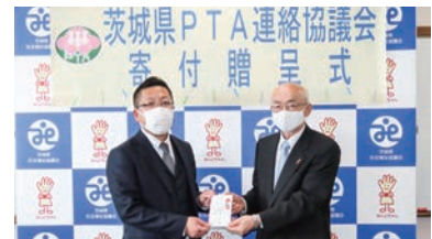
茨城県 PTA 連絡協議会