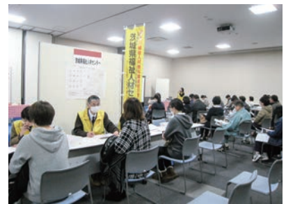
福祉のお仕事フェアの様子 ※画像は2019年11月のもの

学生や福祉の仕事に関心のある人に、実際の高齢者施設で職場体験をする機会を提供します。