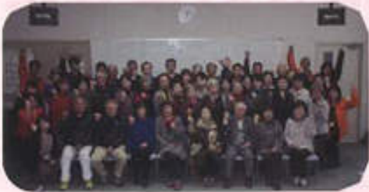
R1.12.2 コミュニティサロン運営者交流

ふれあいサロンは身近で気軽に集まれる場所です。地域の方々の力で生まれその活動は徐々に市内に広がっています。ふれあいサロンの中では、お互いに体調を気遣う声や近況を報告しあう声が聞こえ、少しずつではありますが支えあう姿が自然と生まれています。サロン活動は集いの場を超えて、地域の支えあいづくりの場として期待される活動です。