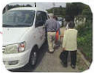
福祉施設による 移動支援