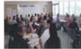
地区別話し合い体験

生活支援体制を進めるために地域について話し合う場を「協議体」といいます。住民が主体となり行政や社会福祉協議会、福祉施設や企業も一緒に考えるところが協議体の特徴です。