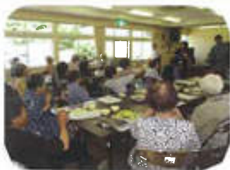
支えあいが生まれる場 ふれあいサロン