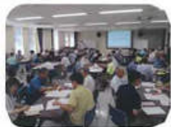
地域についての話し合い 情報共有の場『協議体』