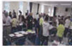
話し合いの進め方勉強会