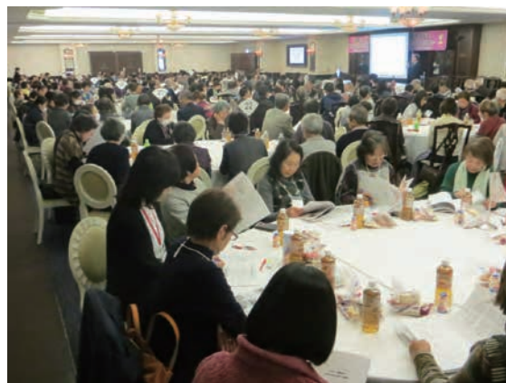
〈「福祉コミュニティづくり推進のつどい」の様子〉