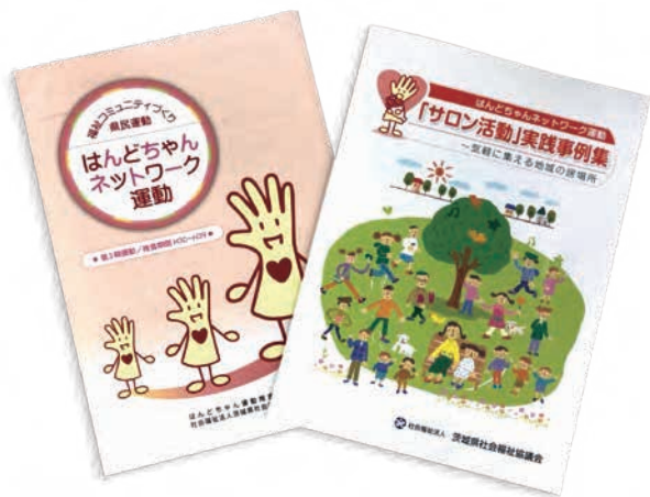
〈サロン活動実践事例集〉