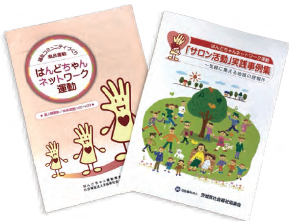
〈サロン活動実践事例集〉