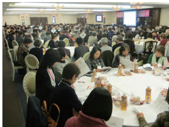
〈「福祉コミュニティづくり推進のつどい」の様子〉