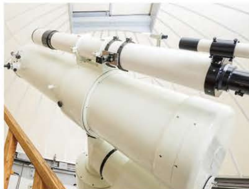
ふれあいの里では天体観測もできます