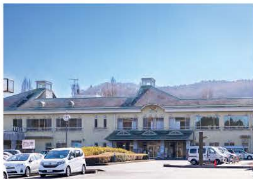
ホロルの湯では歌謡ショーなどのイベントも開催。温泉と音楽で贅沢な一日を

じられる特徴的な香りが漂います。定番のプレートやトーストセットなどのモーニングメニューも人気です。茨城県産の旬の野菜や果物をふんだんに使用しており、色鮮