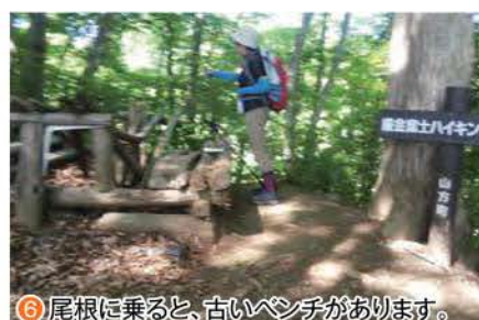
⑥ 尾根に乗ると、古いベンチがあります。