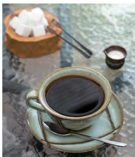
アーシーさ(土っぽさ)が特徴的な城里町ブレンド

もう一品欲しいときにはぜひ天ぷらをご賞味ください。夏から秋にかけて旬を迎える金時草という、葉の裏側が紫色の珍しい野菜の天ぷらに出会えるかも。金時草が入荷した時には物産センターで購入することもできるのでお土産にもぜひ。