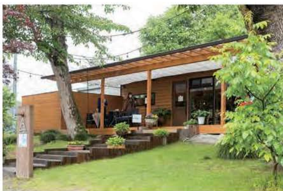
開放感のあるテラス席も完備するMERCY's COFFEE