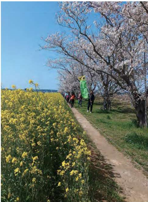
ノルディックウォーキング自然観察会の様子。北浦の北端に位置する安塚公園の桜並木と菜の花を楽しんだコース