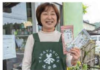
笑顔の奥様がお出迎えしてくれます

販売を手掛けており、地元住民のみならず遠方から訪れる常連客も多くいます。まろやかな飲み口の良さが多くの人に愛される秘訣の一つ。上品な香りが茶摘みの光景を連想させます。「おいしいお茶は、良い土地や水があつてこそ。夏の暑い時期でも、古内茶を飲むことで元気な体を保つことができている」と好評です。おいしいお茶を淹れるコツは、ぬるめのお湯を使うこと。お茶の濃さはお好みで。自分にピッタリな香り、甘み、コク、そしてわずかな苦みを感じられる量を探してみるのも楽しいですね。ティーバッグでも十分お茶のうまみを感じられますが、急須で淹れた古内茶は格別。高安園では緑茶だけでなく、古内の在来種茶葉を発酵させた茶葉で作った和紅茶も製造しています。熱めのお湯で淹れて1分ほど蒸らすと、すっきりとした香りある和紅茶を楽しめます。