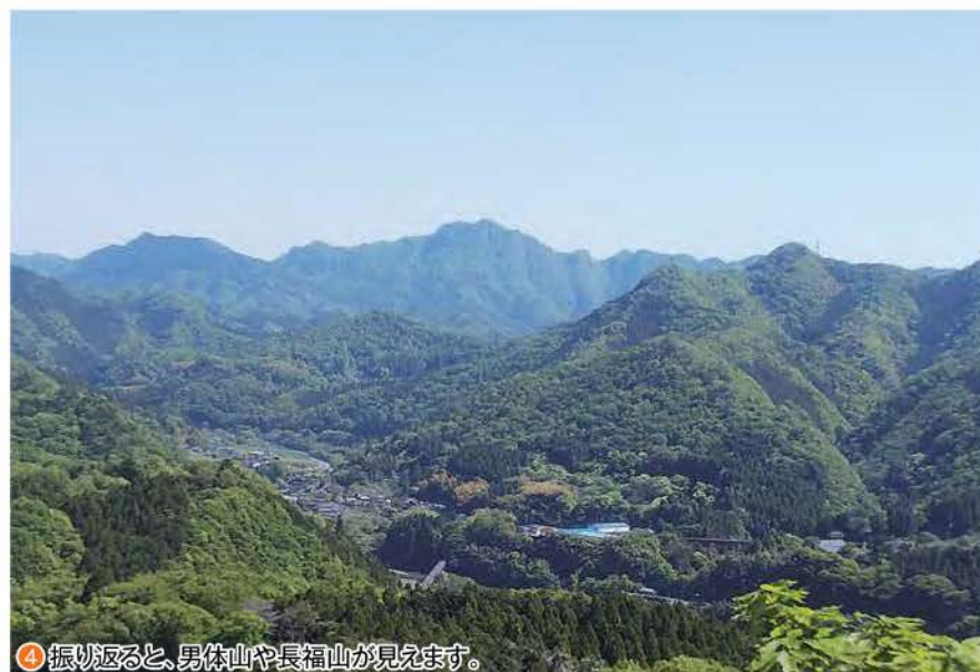
④ 振り返ると、男体山や長福山が見えます。

の鳥居に出ます。隣りには「富士山頂へ登古道」の道標もあります。ここから広葉樹の山道をゆつくりと登っていきます。擬木の階段の道となり少し登ると、視界が開けて檜林の伐採地に出ます。今は幼木が育っていますが、心地良い風が吹いていました。 広い伐採地の中を少し登って振り返ると、右手から順に明山から東金砂山方面、熊野山から男体山、長福山が見えます。山頂に続く尾根を目指して更に登ります。途中にはカシの大木が倒壊して門構えのような景観を見せています。尾根に乗ったところに古いベンチがあり、休憩ポイントです。 尾根に付けられた擬木の階段を登っていきます。イワウチワは右