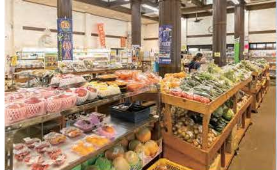
旬の新鮮野菜がズラリと並びます