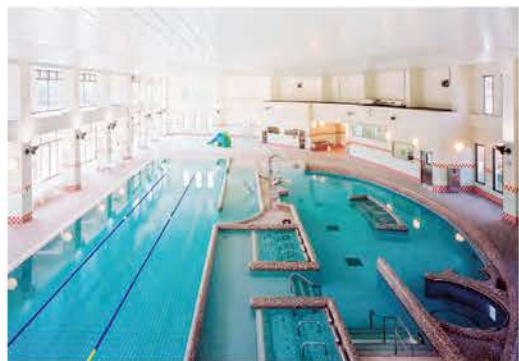
ホロルの湯には温水プールも完備!