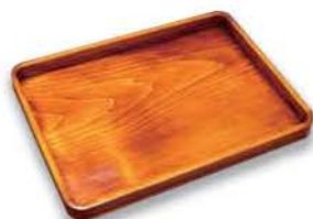
栗野春慶塗 長盆 …… 2名様

★締め切りは令和5年7月31日(消印有効)です。当選者については市町村名と苗字のみを次号に掲載し発表とさせていただきます。