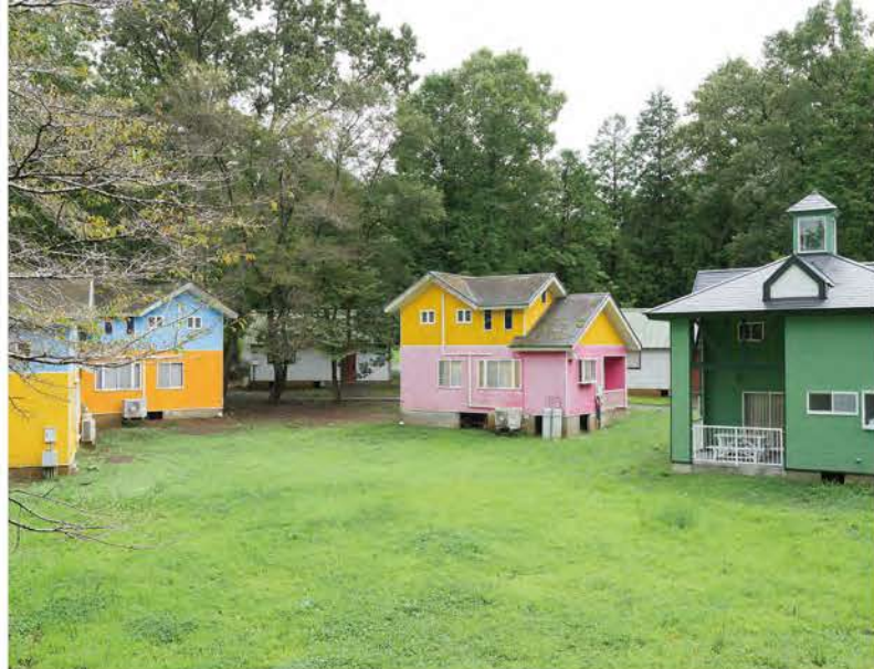
広いキャビンで気軽にキャンプが楽しめるふれあいの里