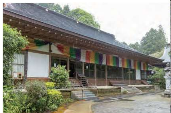
小松寺。本堂裏にある平重盛公の墓もぜひ見学を