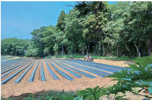
譲り受けた農地で畑仕事をしているところ。北浦を見下ろす高台で、とても見晴らしの良い場所なのだそう