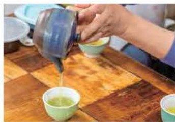
湯呑を温めてから淹れると◎