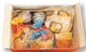
社会福祉法人茨城補成会 はたらくガッツ村 スイーツ工房 お菓子詰め合わせ …… 5名様