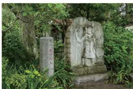
本堂前には佐竹七福神のひとつ毘沙門天像が