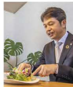
大井川知事も絶賛！