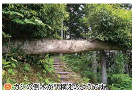
⑤ カシの倒木が門構えのようです。