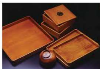
城里町のふるさと納税返礼品にも選出。下地はヒノキ、漆は大子産