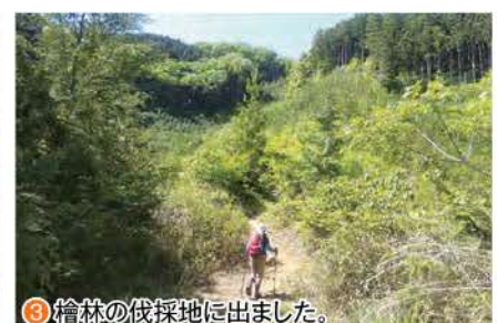
③ 檜林の伐採地に出ました。