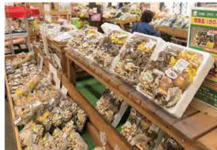
キノコの詰め合わせはお土産でも人気