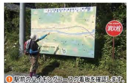
① 駅前のハイキングコースの看板を確認します。