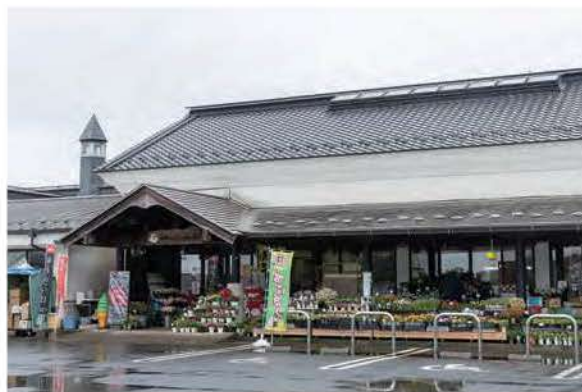
物産センター山桜店頭には色とりどりの花が並ぶ

に会うことができるかもしれません。レジ横では城里町産のやぶきた茶を使用した「やぶきたソフトクリーム」を販売しています。口に含んだ瞬間鼻に抜けるお茶の香り。ほんのりとした甘さとの相性も抜群で、クセになる逸品です。物産センターに隣接する食堂では、地元のそば粉を使用した常陸秋そばを楽しむことができます。気温や湿度によって毎日水加減を調整して作る麺は、食べ応えのある少し太めの七三蕎麦。これからの季節、人気を集めるのは季節限定の「ひやしたぬきそば」です。あと