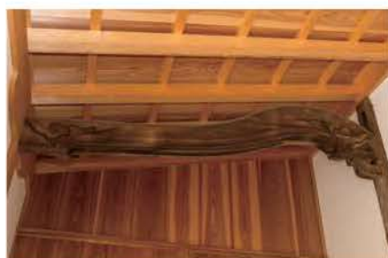
曲がり具合に時代の特徴が出る「海老虹梁」