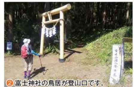
② 富士神社の鳥居が登山口です。