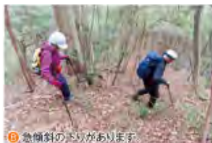
⑧ 急傾斜の下りがあります。