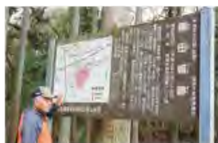
東西1200m、南北800mにもおよび巨大城郭であった額田城