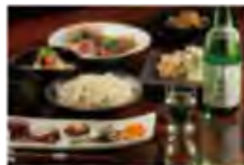
蔵+蕎麦 な嘉屋では食事と共に木内酒造のお酒も味わえます

木内酒造は1823年創業、200年の歴史を持つ那珂市の老舗酒蔵です。清酒「菊盛」をはじめ、日本を代表するクラフトビール「常陸野ネストビール」、更には石岡市