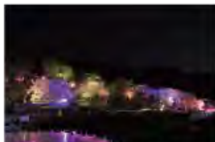
八重桜まつり期間中は夜桜のライトアップを実施