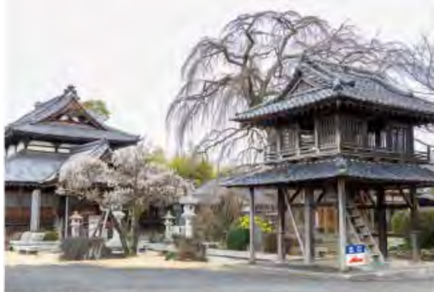
県指定文化財となっている親鸞聖人御旧蹟である阿弥陀寺