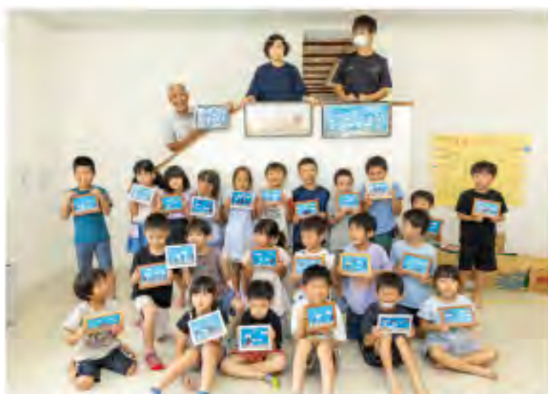
民間学童MAPSの子どもたちと、完成した貝殻水族館を持って記念撮影。音楽しんでくれていました。