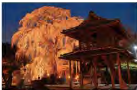
毎年見頃を迎えた時期の21時頃までライトアップしています