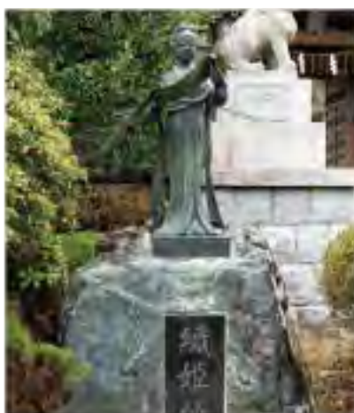
境内には織姫像が奉納されています