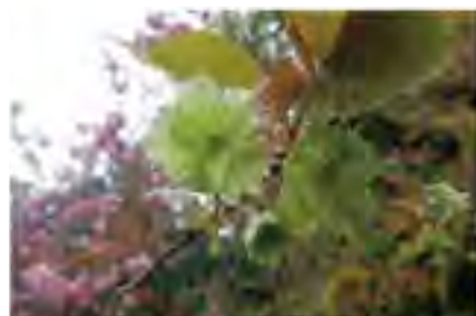
静峰ふるさと公園に来たら絶対に見て欲しい品種の御衣黄