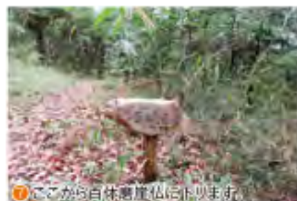
⑦ ここから百体磨崖仏に歩きます。