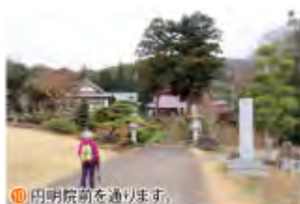
⑩ 円明院前を通ります。

三ツ石森林公園もりの小屋 → 浅間山 【1.0km 40分】 浅間山 → 閑居山 【1.0km 25分】 閑居山 → 百体磨崖仏 【0.8km 20分】 百体磨崖仏 → 森林総合研究所四阿 【0.3km 10分】 森林総合研究所四阿 → 円明院 【2.1km 40分】 円明院 → 三ツ石森林公園もりの小屋 【0.7km 25分】