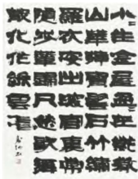
●書● 石川 壽仙 水戸市 【題名】 李白詩