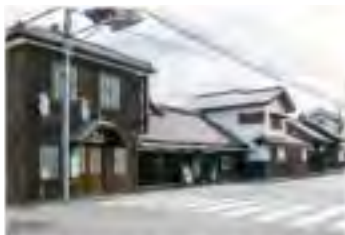
本店では日本酒、梅酒等を醸造。手造りビール工房も有