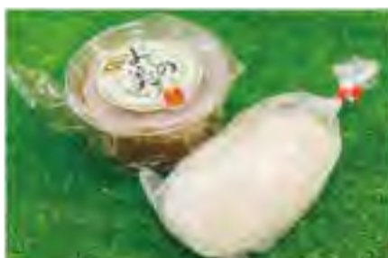
地元産うるち米を使った「殿中餅」と青大豆を100%使用した味噌「よしの美人」