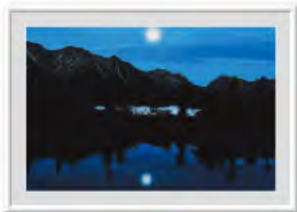
●写真● 今泉 純子 潮来市 【題名】 月光