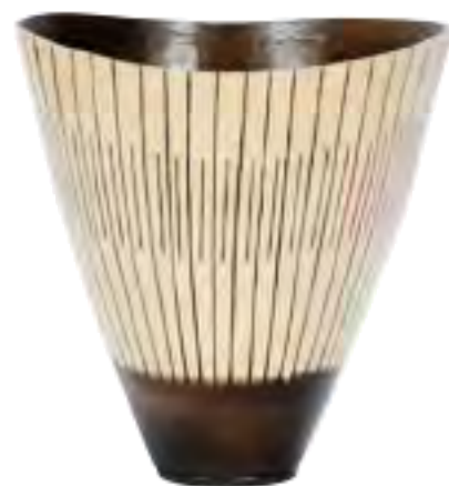
●工芸● 大久保 等 鹿嶋市 【題名】 線文象嵌器