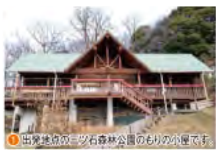
① 出発地点の三ツ石森林公園のもりの小屋です。