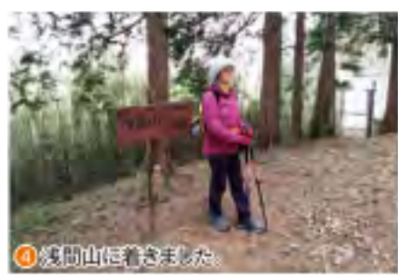
④ 浅間山に着きました。