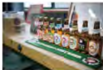
常陸野ネストビールは国内のみならず世界約40ヵ国へ輸出