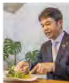
大井川知事も絶賛！