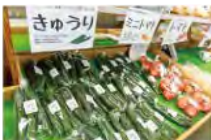
ふれあいファーム芳野には新鮮な朝採れ野菜が並びます