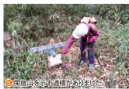
③ 閑居山を示す道標がありました。

先程の分岐まで戻り、閑居山を指します。檜の中の緩やかな登山道を下ります。半田林道への分岐を過ぎると、右手に大きく枝を上げた立派な檜の木がありました。更にゆるゆると下ると、秋葉峠と権現山方向を示す道標に「YAMAP」が出てくる閑居山」という紙が貼り付けられているのを見つけました。ピークとは思えないような地点なので見逃しそ