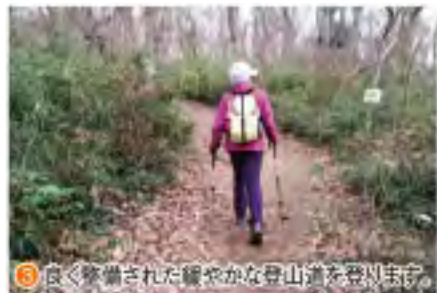
⑥ 良く整備された緩やかな登山道を登りまわす。