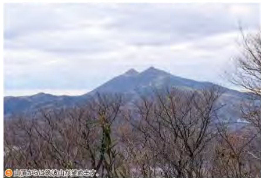
⑤ 山頂からは筑波山が望めます。