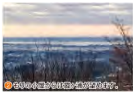
② もりの小屋から世羅の僧が隠れます。