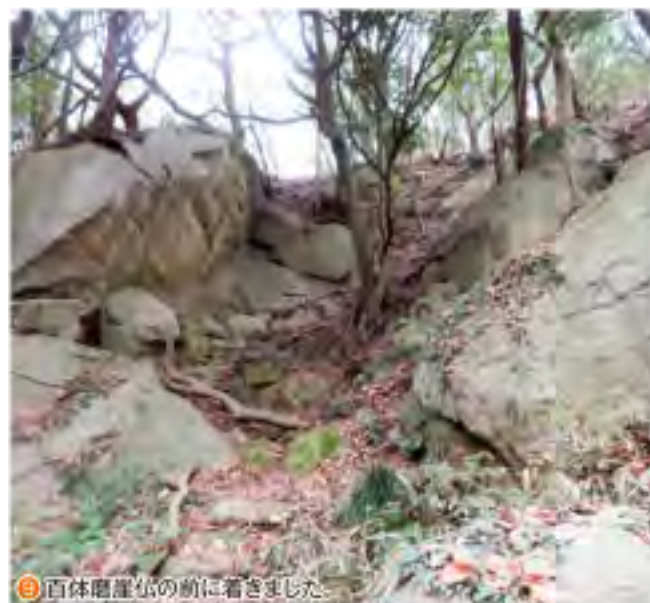
⑨ 百体磨崖仏の前に着きました。

うです。樹林の中のため視界はあり ません。 更に緩やかに少し下ると、百体摩 崖仏への小さな道標がありました。こ こから百体磨崖仏までは約100mほ ど下ります。始めは落ち葉が敷き詰 められた緩やかな傾斜の下り道です が、直ぐに急傾斜となり、木々に付け られた赤ペンキ、赤テープを確認しな がら下りました。大きな岩を右手に 過ぎると、平らな登山道に出ました。 少し辿ると百体磨崖仏の説明板があ りました。手前には奥行15mの金堀穴 があり、覗いてみると中は真っ暗です。 花崗岩の巨岩には百体余りの地藏菩 薩や観音菩薩が彫られており、茨城 県指定文化財となっています。作られ