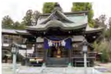
常陸二ノ宮として古くから信仰を集める静神社