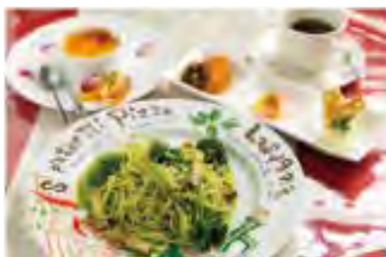
芳野バジルのジェノベーゼソース ランチセットは1,680円